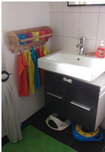
- Das Bad -

Hygieneartikel, wie Feuchttücher, Pampers, Taschentücher etc. sind durch die Sorgeberechtigten mitzubringen.