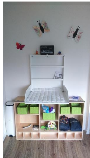
- Der Wickelbereich -