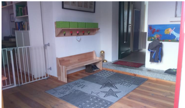
- Der Eingangsbereich –

Zur Kindgerechten Ausstattung der Räumlichkeiten gehört im Erdgeschoss eine Küche mit Essbereich, ein Bad sowie ein separates Spielzimmer. In der ersten Etage befindet sich ein Ruheraum. Für Schlafplätze ist durch feststehende Kinderbetten gesorgt. Zu unserem Haus gehört auch ein großer Garten (700 qm), der den Kindern viel Platz zum Spielen bietet. Hier befinden sich ein Sandkasten, ein Kinderhaus, eine Rutsche und mehrere Fahrzeuge ( Bobby Car, Roller ,Traktor ) sowie jede Menge Sandspielzeug.