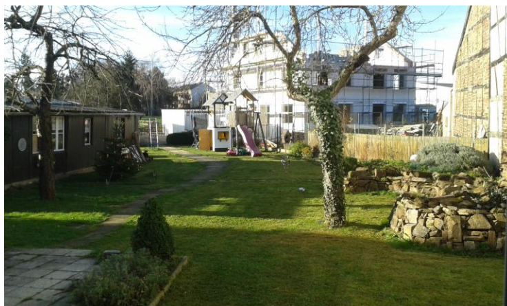
- Der Außenbereich -

„Wenn man genügend spielt solange man klein ist, trägt man Schätze in sich herum, aus denen man später sein Leben lang schöpfen kann“ (Astrid Lindgren)