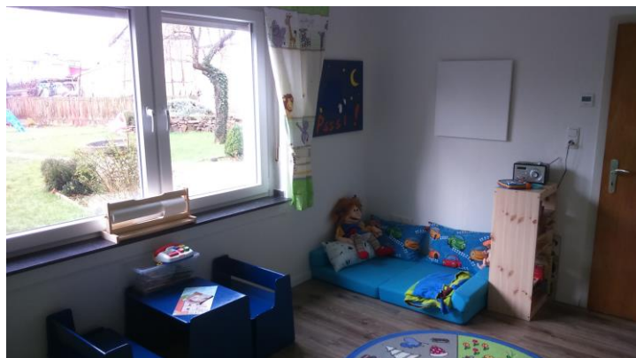
- Die Ruhecke-