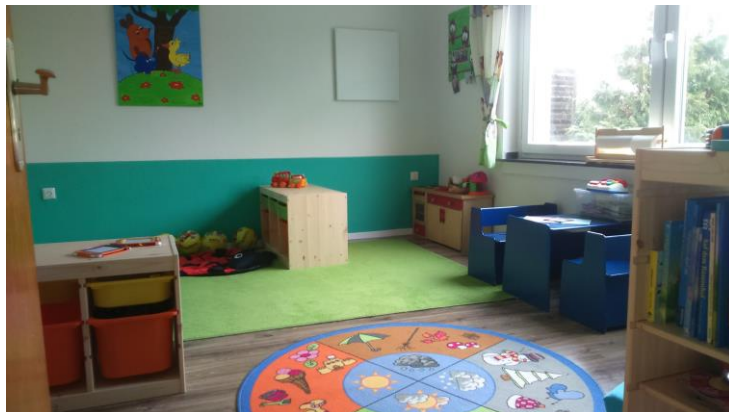
- Der Spielraum –

Mehrere Bobby Cars, Traktoren, ein Sandkasten, sowie drei Schaukel und zwei Rutschen bieten neben dem Platz zum einfachen Fußballspielen genug Raum zum „Sauerstoff tanken und auspowern“.