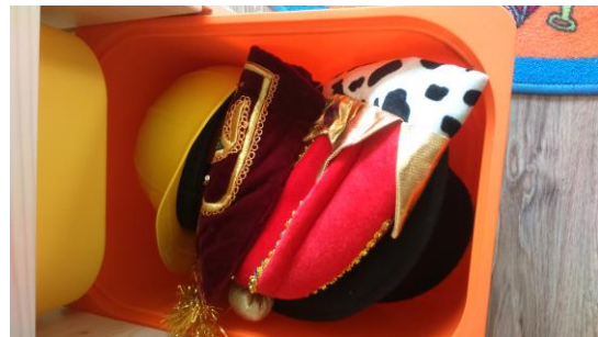
- verkleiden -