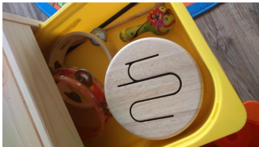
- musizieren -