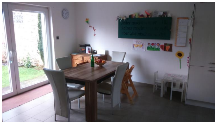
- Die Küche -

Meine Betreuungszeiten sind Montag – Freitag von 07:30 – 15.00 Uhr.