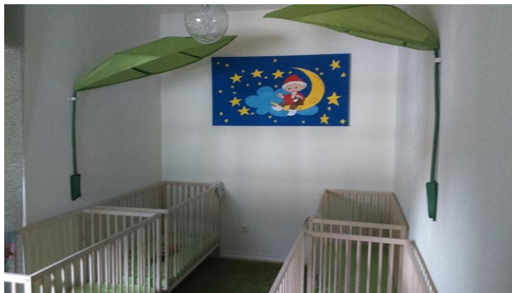
- Der Schlafbereich -

Ich, als Tagesmutter kann die Kinder darin unterstützen in dem ich sie durch Lob und Anerkennung motiviere.